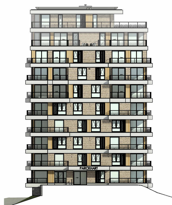
Linker zijgevel (noordoost)