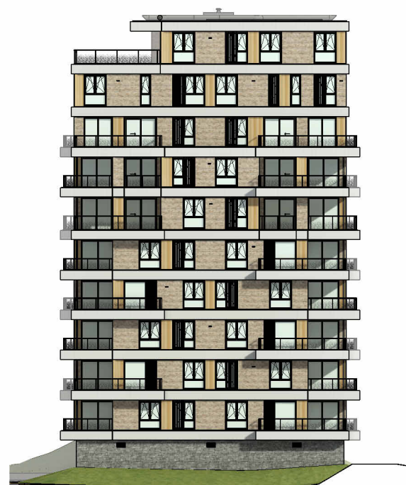
Rechter zijgevel (zuidwest)